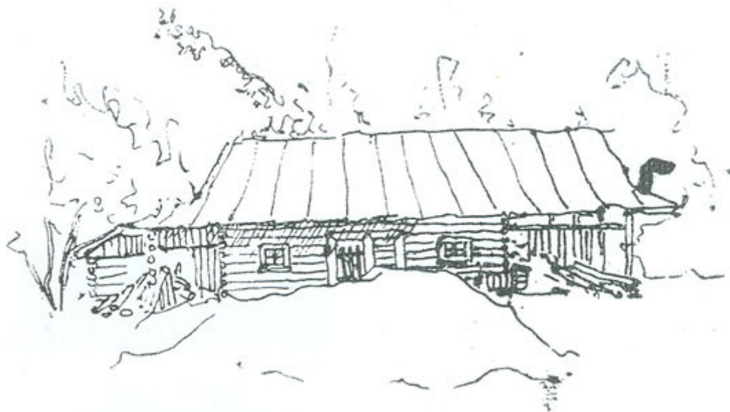
Chalupa z Košařisk, kresba L. Báci