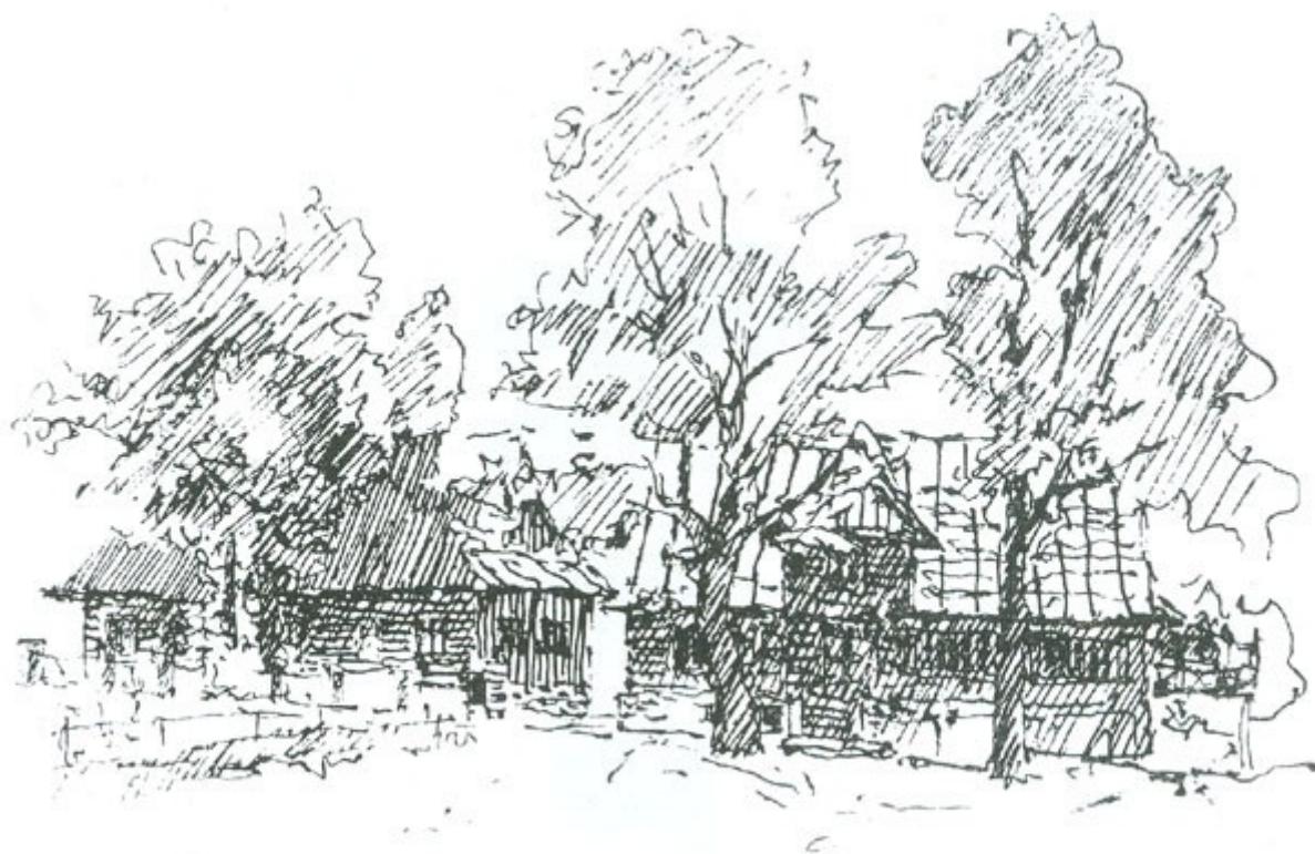
Usedlost z Njdku, kresba L. Báci